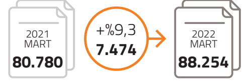
Mart ayında en çok kapasite raporu düzenlenen ilk 10 il

TOBB Sanayi Veri Tabanındaki aktif kapasite raporlarının toplam sayısı